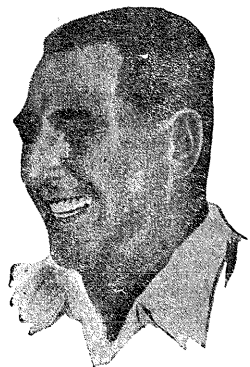
Juan Perón Primer Embajador Argentino