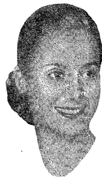
Eva Perón Jefa Espiritual de la Nación